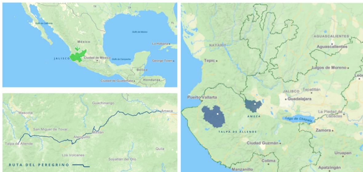
Figura 1. Localización de la Ruta del Peregrino.

de Allende, los cuales abarcan 117 kilómetros de la Sierra Occidental de Jalisco. Tiene diferentes ramificaciones que se extienden a otros municipios del centro y sur de Jalisco, las cuales a su vez se prolongan por los estados vecinos de Nayarit (ruta de Mascota), Colima (ruta de Tuxpan) y Michoacán (ruta San José de Gracia) y algunas conectan con la capital (Adriá, 2011; González, Miranda, Rodríguez, Ramírez, Sandoval, Monti & Barajas, 2006).