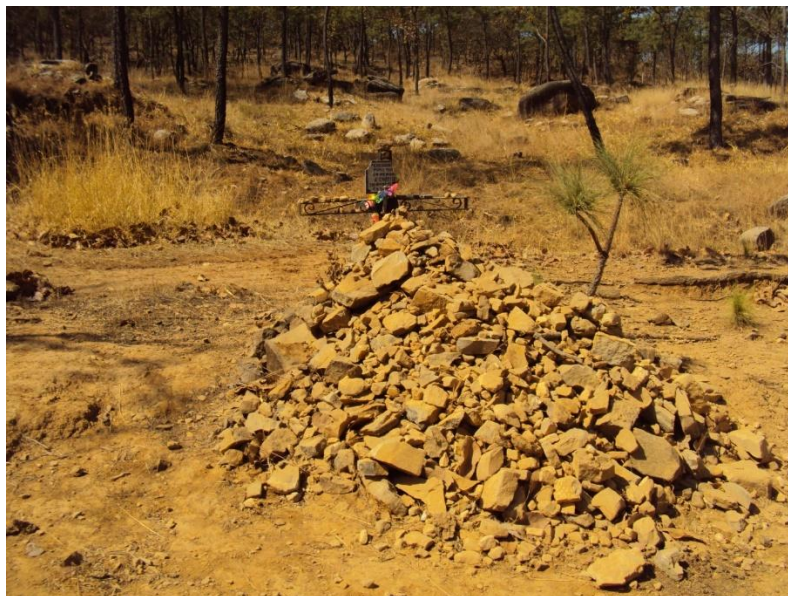
Figura 4. En memoria