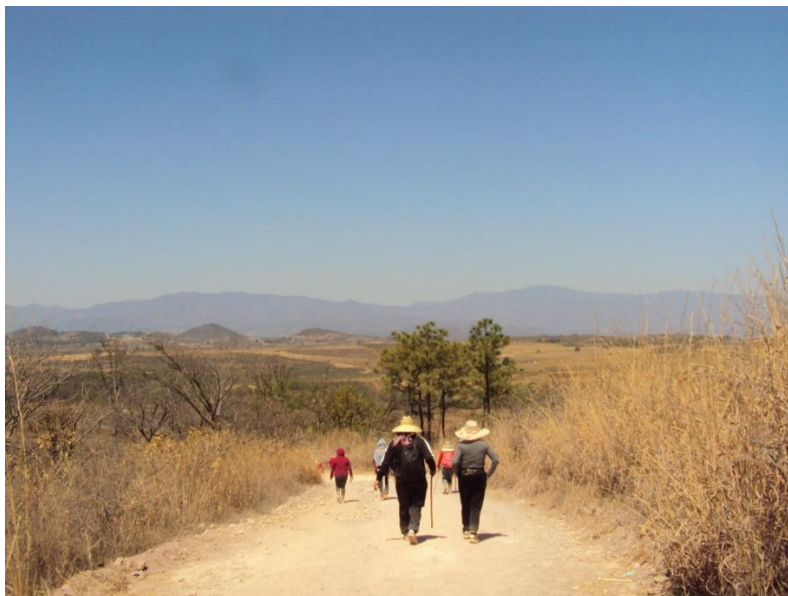
Figura 3. ¿Los árboles?