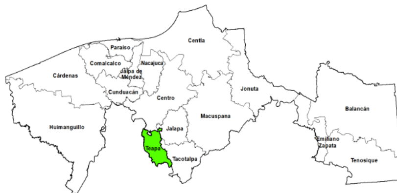
Figura 1. Ubicación del municipio de Teapa en el estado de Tabasco.

Teapa, Tabasco, se localiza en la subregión de la sierra al sur de la entidad, en una altitud que oscila entre los 0 y los 1,000 metros sobre el nivel del mar. Colinda con los municipios de Centro, donde se ubica la ciudad de Villahermosa, capital del estado, y Jalapa: al este con este último municipio y Tacotalpa, y al oeste con el estado de Chiapas. Su superficie, comprende 420.62 km 2 , lo que representa el 1.70% del territorio de Tabasco, ubicándolo en el municipio con la posición 15 en cuanto a extensión (INEGI, 2021) (figura 1).