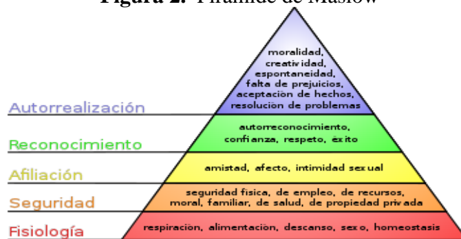
Figura 2. Pirámide de Maslow

Cuando la falta de respeto se vuelve una constante, trae falta de confianza y desazón a la mujer y su hogar, con consecuencias negativas e incuantificables. Observando la pirámide de Maslow (figura 2), el acoso confluye en los cinco bloques, que son Fisiología, seguridad, afiliación, reconocimiento, autorrealización.