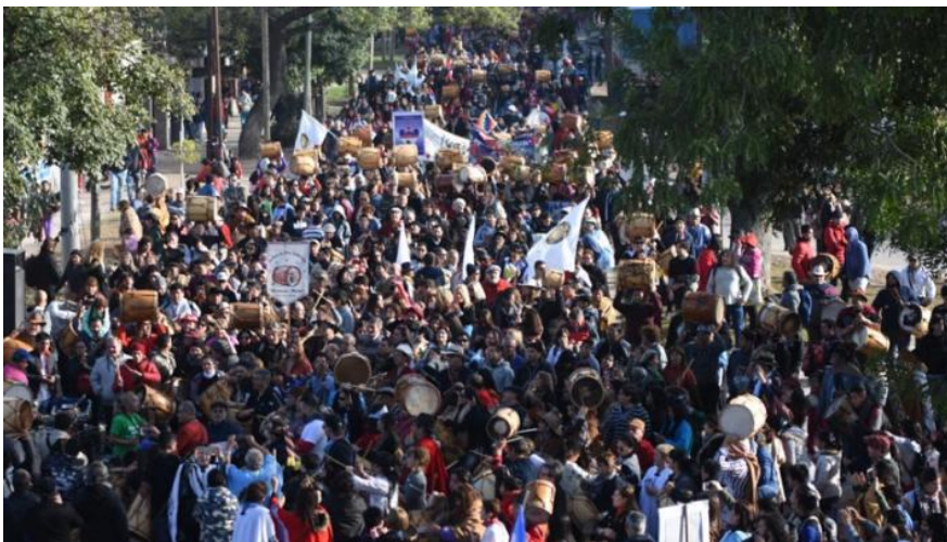
Figura 8. “Festejos Populares en la semana de Santiago”

Fuente: La Marcha de los bombos”Diario Panorama Santiago del Estero (Oscar Armas) 25/7/2017