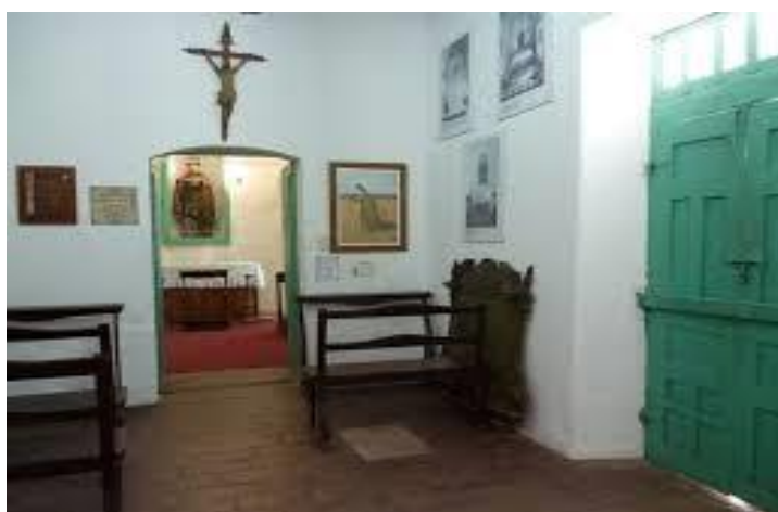
Figura 5. Celda capilla de San Francisco Solano