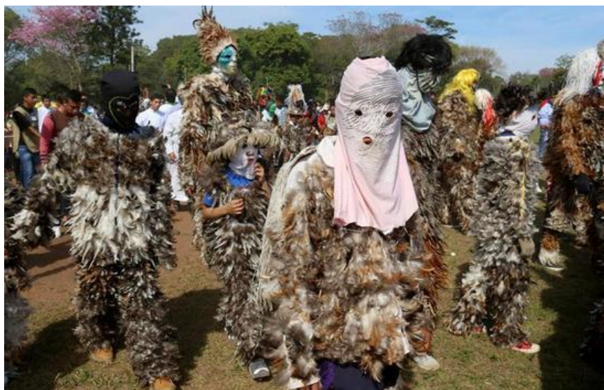
Figura 11. “Vestidos a la usanza de los nativos evangelizados por San Francisco”