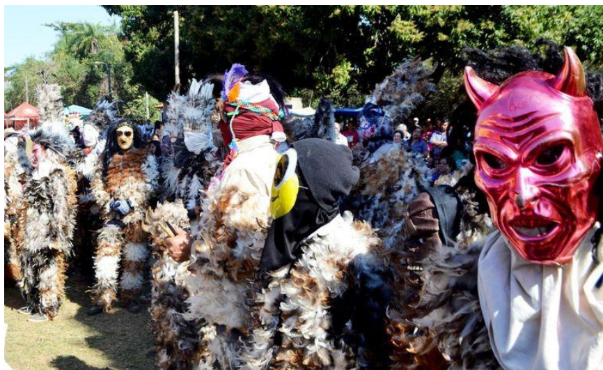
Figura 10. “Festejos de San Francisco en Paraguay”