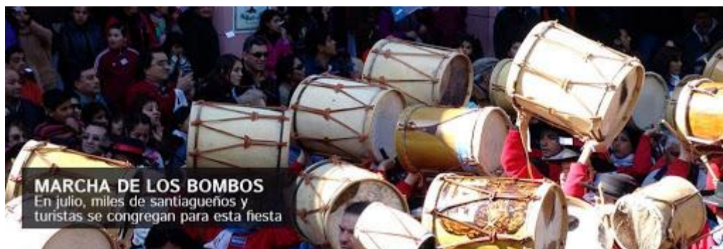
Figura 7. “La Marcha de los bombos