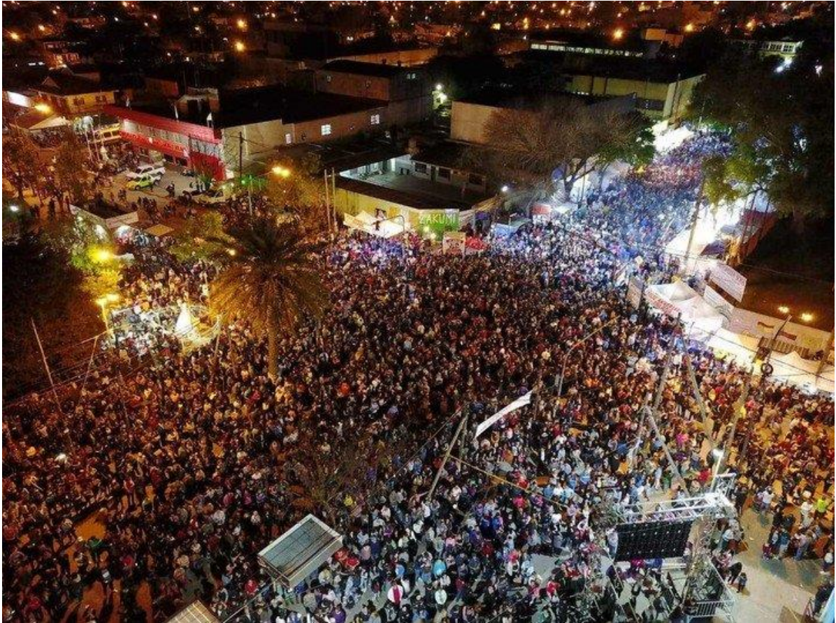
Figura 12. "Festejos"

Fuente: Diario Clarín.com Zonales SAN FRANCISCO SOLANO 15/10/2018 20:09