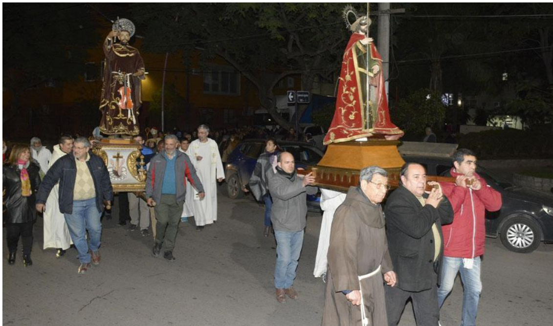
Figura 6. Procesión en la noche de San Francisco en Santiago del Estero