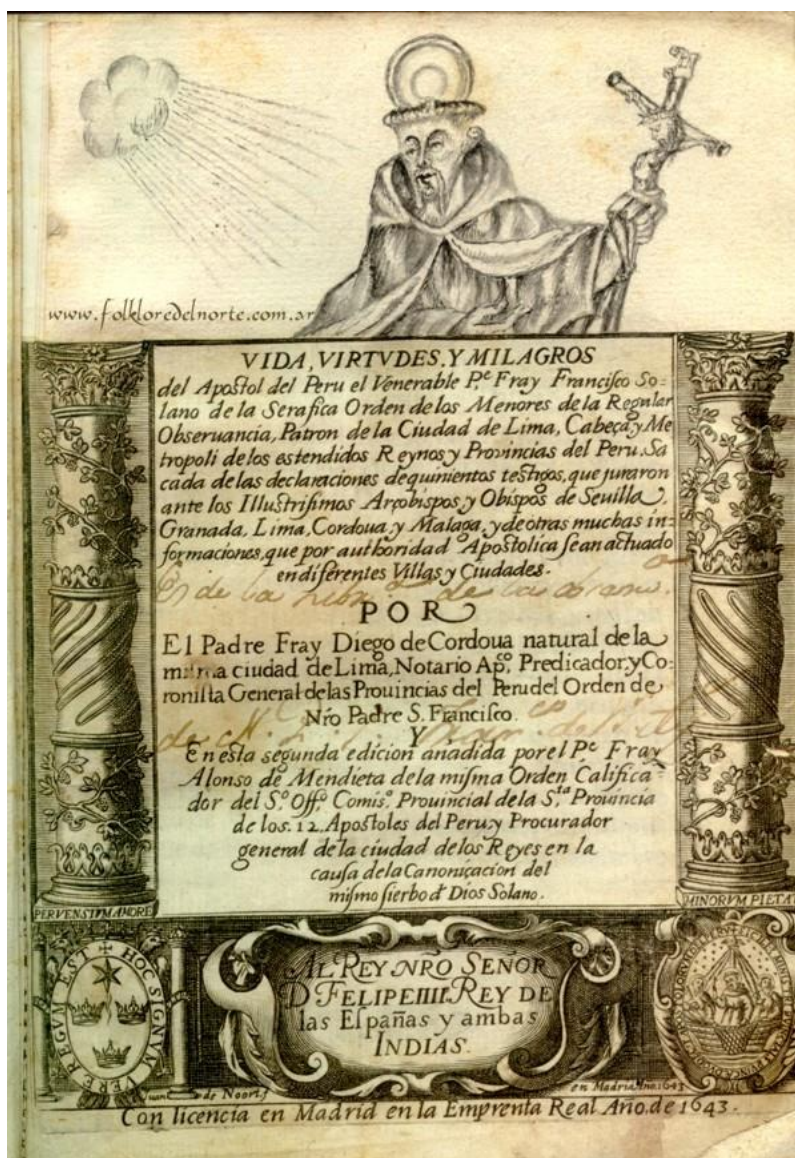
Figura 1. "PRIMER RETRATO"