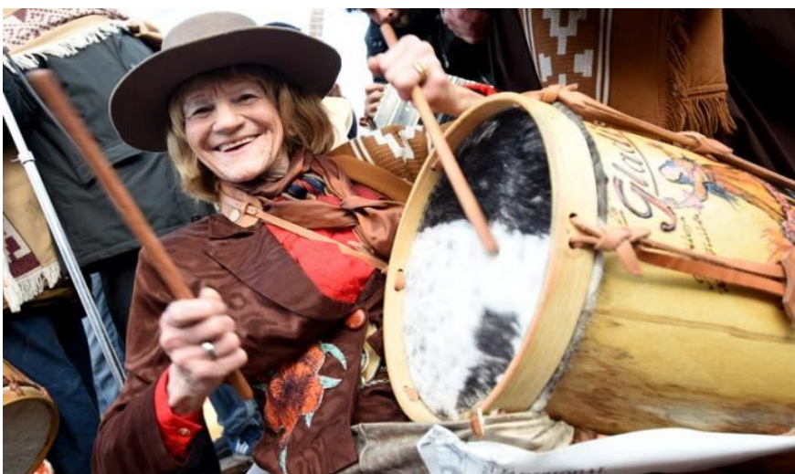
Figura 9. “Bombista Santiagueña”