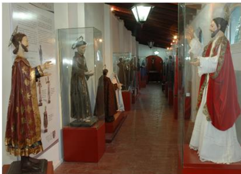
Figura 4. Interior del Museo de Arte Sacro