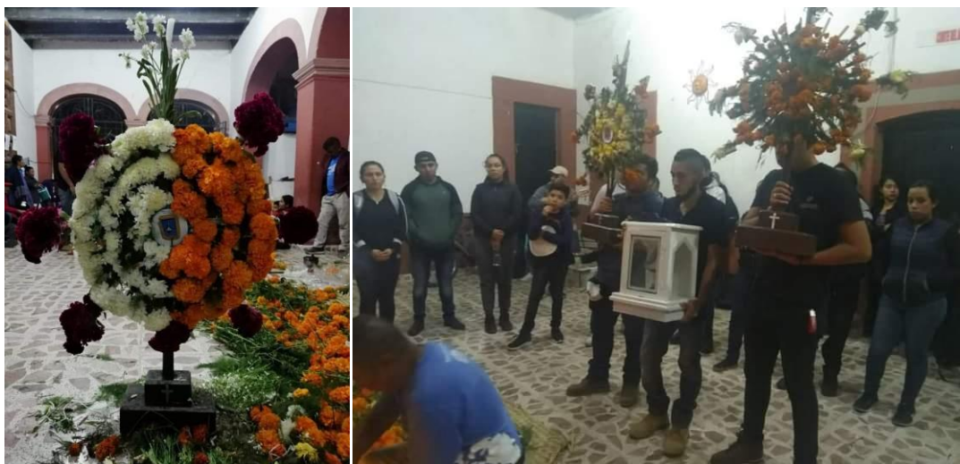
Figura 5: Ornamentación de flores y ofrenda a la virgen