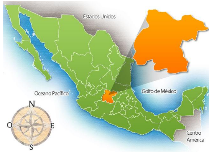
Figura 1: Ubicación geográfica del estado de Guanajuato