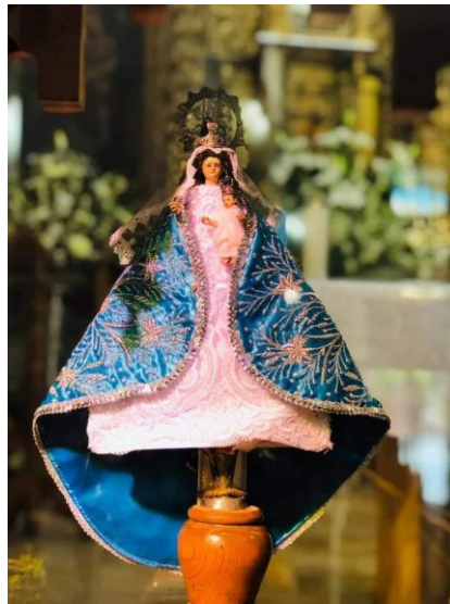
Figura 3: Virgen de los Remedios de Comonfort, Gto.