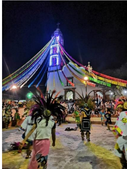
Figura 4: Danza azteca