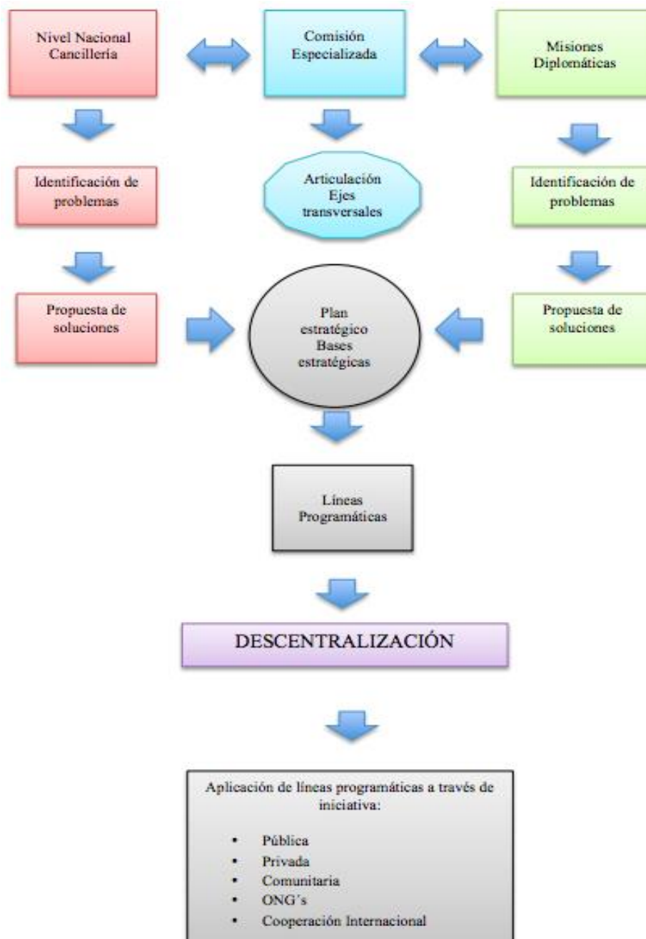
Figura 2. Proceso de las bases estratégicas del plan