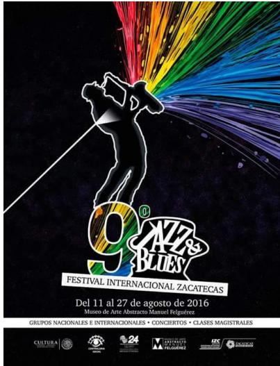
Figura 3: Cartel Festival Jazz & Blues Zacatecas 2016

Otro tipo de manifestaciones musicales se ofertan a la población en el mes de septiembre, durante la Feria Nacional de Zacatecas , donde los espectáculos musicales son variados. En cambio, en el mes de octubre se puntualiza sobre un tipo de música con el Festival Barroco del Museo de Guadalupe , y el Festival de Teatro de la Calle .