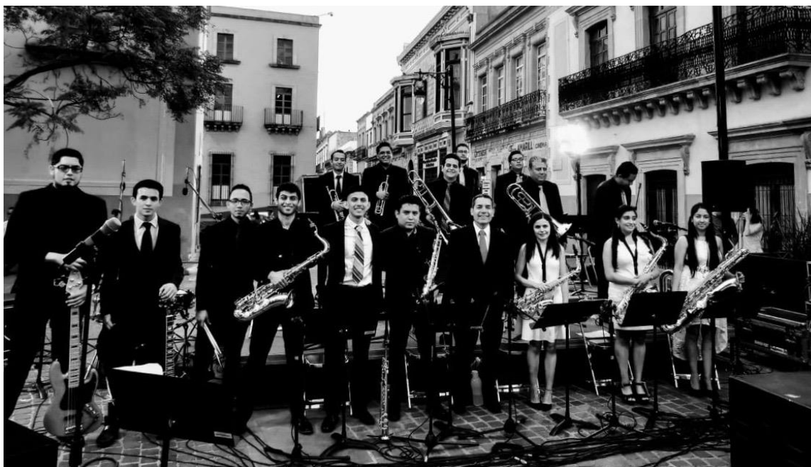
Figura 9. Concierto Orquesta de Jazz Artes UAZ (2019).

Todas las transformaciones a la traza urbana de las ciudades tienen consecuencias, en el caso de la Plazuela Miguel Auza, este cambio ha sido significativamente positivo, sobre todo en lo referente al rescate de la memoria colectiva, recuperada y puesta en valor para la ciudadanía que la habita, visita y que por ende se enriquece constantemente al disfrutar de todos aquellos espectáculos que se prevén en este espacio, así como de las áreas que por sí mismas poseen encanto.