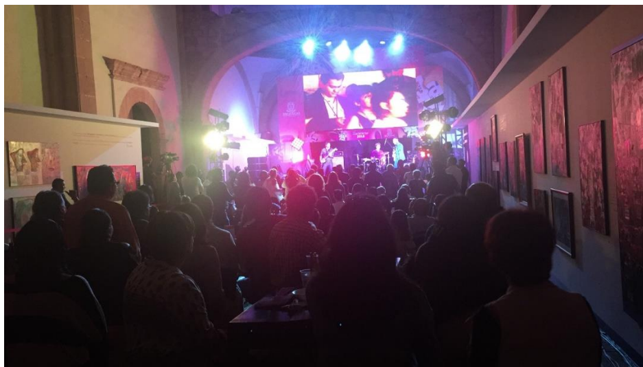
Figura 7. Festival de Jazz & Blues (2018) celebrado en la bóveda del templo del hoy Museo Rafael Coronel