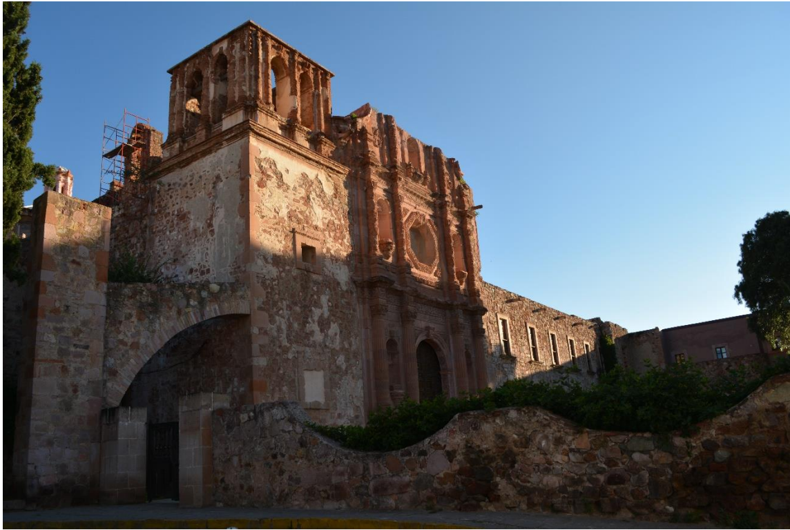
Figura 5. Ex templo de San Francisco (2020).