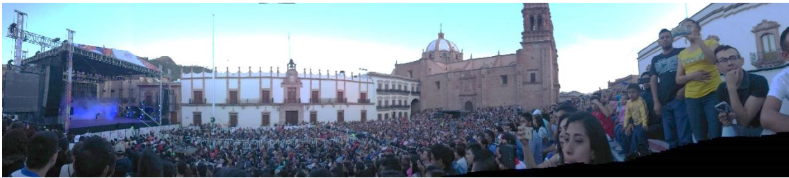
Figura 10. Plaza de Armas. Festival del Folklore (2017).