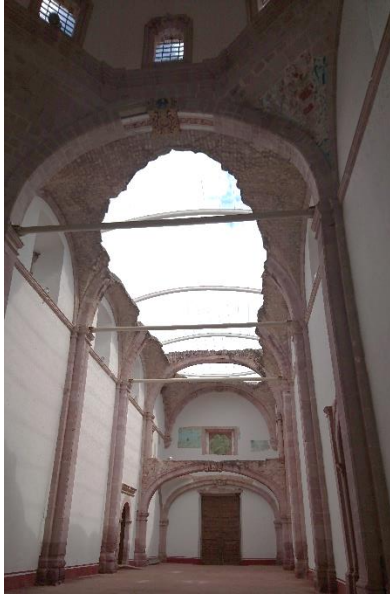
Figura 6. Nave del Ex Templo de San Francisco (2018).