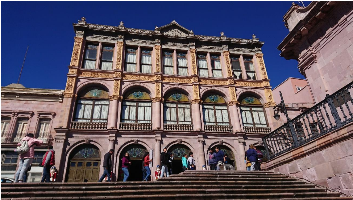
Figura 8. Teatro Fernando Calderón (2019).