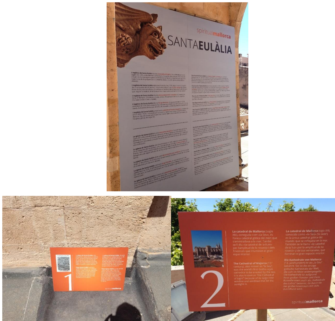
Figura 5, 6 y 7. Reproducción del sistema de paneles explicativos del recorrido exterior por sus terrazas