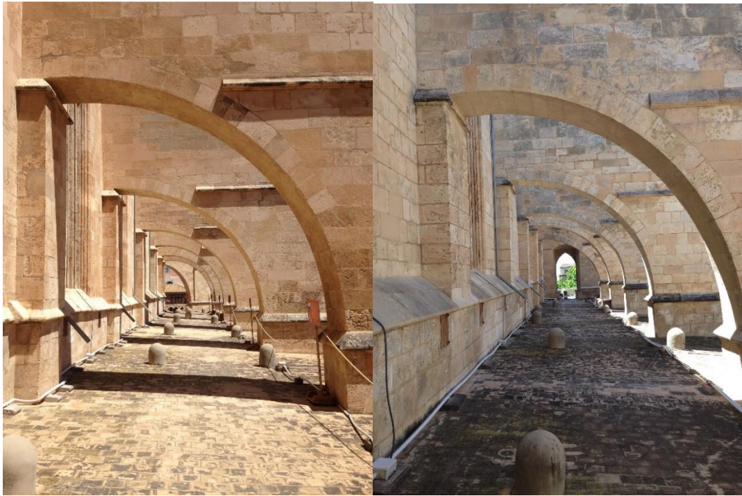
Figura 3 y 4. Reproducción del recorrido exterior por las terrazas de las naves laterales