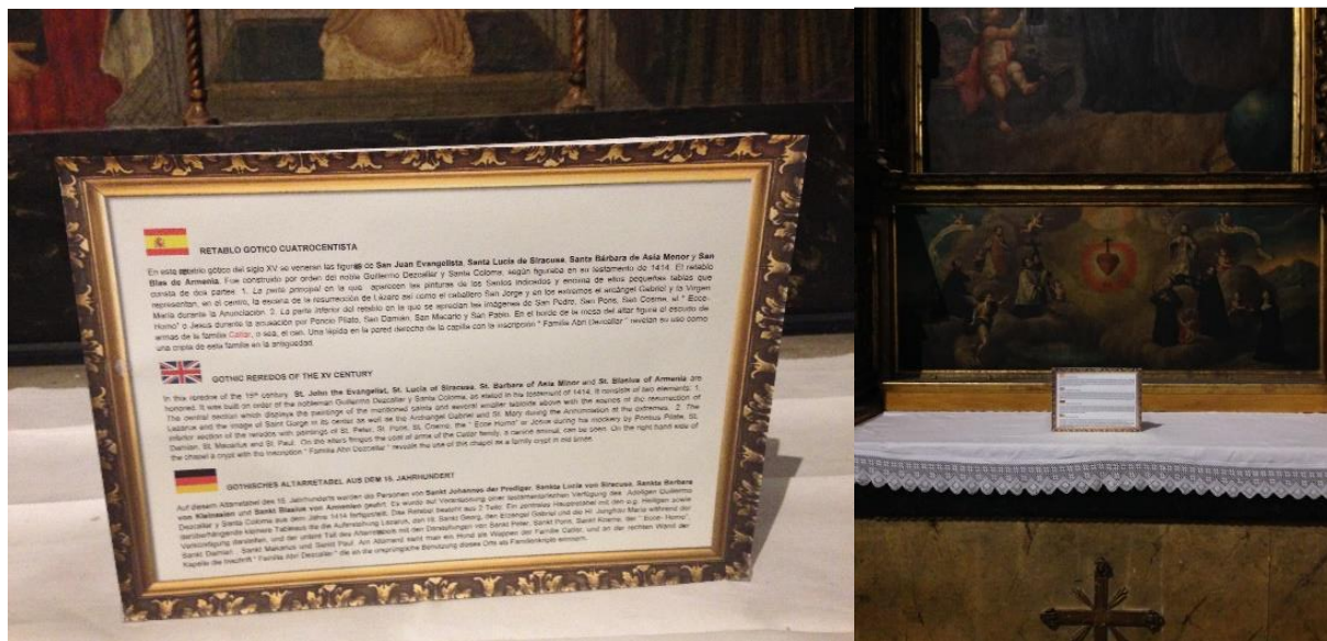
Figura 1 y 2. Reproducción del sistema de paneles ubicados en las capillas durante el 2016

diarias, sin ningún patrón o criterio económico para gestionarlas o administrarlas. Por otro lado, dentro de los recursos ofrecidos para su interpretación, destacaba una museografía del interior escasa y deficiente configurada a través de una serie de paneles con una mínima explicación histórica de los espacios o piezas (figura 1 y 2). La disposición de la información en este sistema de rotulación, aunque en diversos idiomas, presentaba una cierta dificultad de lectura teniendo en cuenta la dimensión de la letra y la ubicación de la cartela, cuestiones que imposibilitaba la correcta contemplación e interpretación de la pieza, sumado a que la información proporcionada era breve y repetitiva en cuanto a sus capacidades documentales.