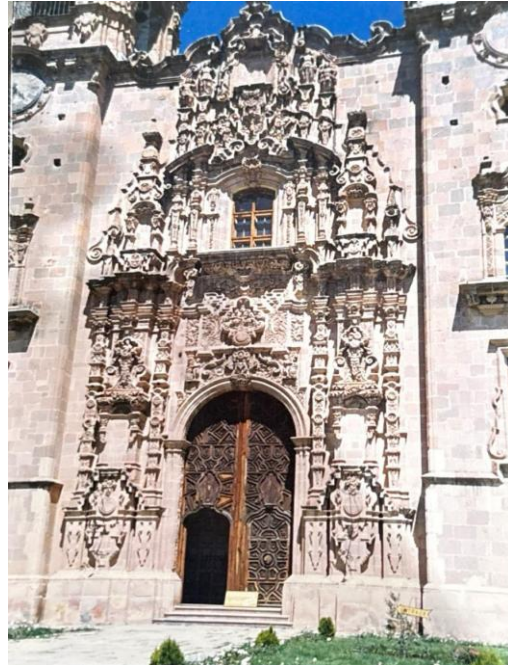
Figura 3. Templo de San Cayetano, la Valenciana