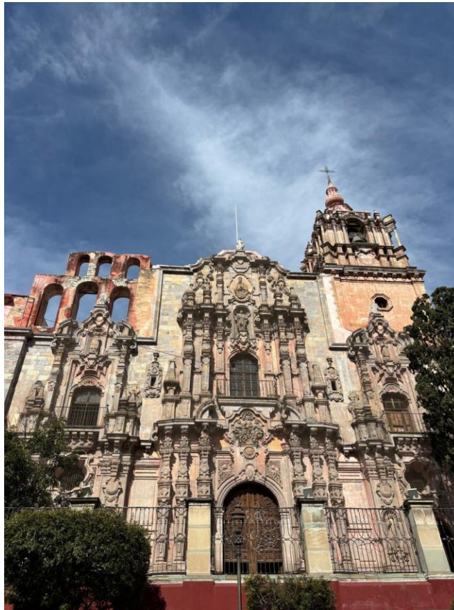
Figura 2. Templo de la Compañía de Jesús en Guanajuato

3. Minerales de Rayas y Cata – Templos del Señor de Rayas y del Señor de Villaseca (Figura 4).