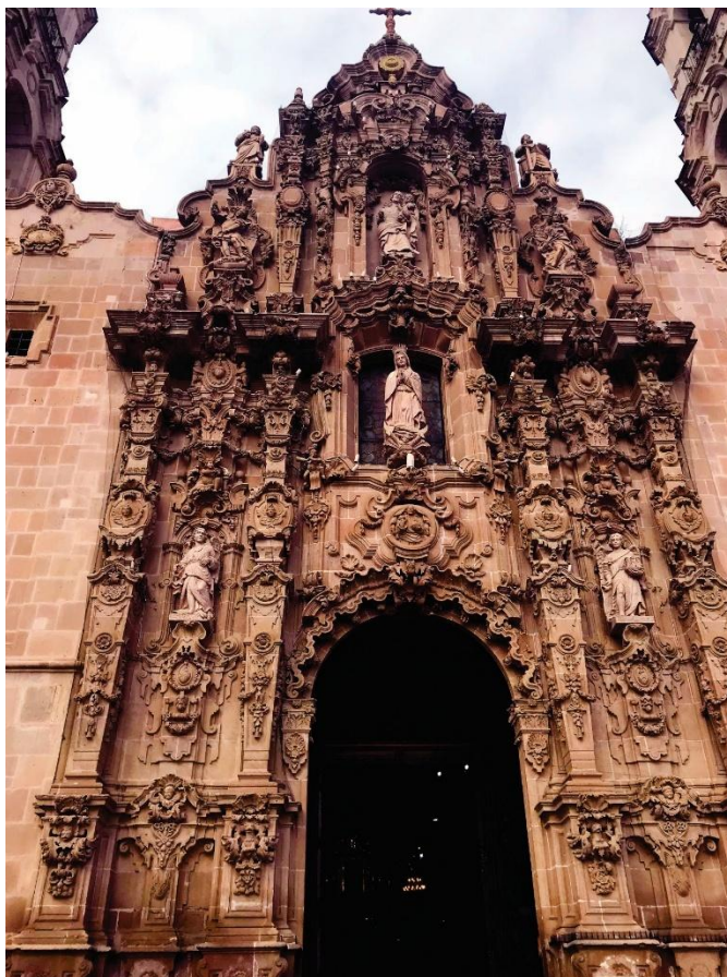
Figura 5. Santuario de Nuestra Señora de Guadalupe, Aguascalientes

De la misma manera, la Parroquia de Nuestra Señora de la Asunción, en Lagos de Moreno, constituye un referente de la devoción mariana y de la apropiación local de lenguajes barrocos. Su monumentalidad y riqueza decorativa expresan la capacidad de las comunidades del norte del Bajío para reinterpretar modelos arquitectónicos en función de sus propias tradiciones y necesidades. El turismo cultural, al destacar este templo como punto de interés, contribuye a la preservación de un patrimonio que articula identidad religiosa, memoria histórica y creatividad formal.