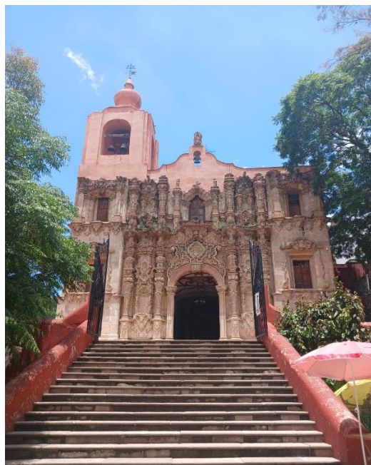
Figura 4. Templo del Señor de Villaseca, Mineral de Cata