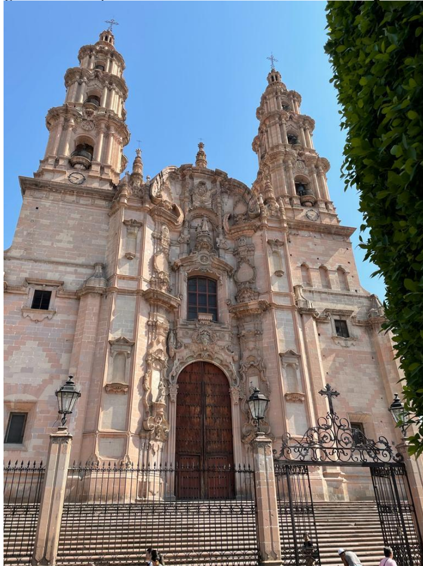
Figura 7. Parroquia de Nuestra Señora de la Asunción, Lagos de Moreno