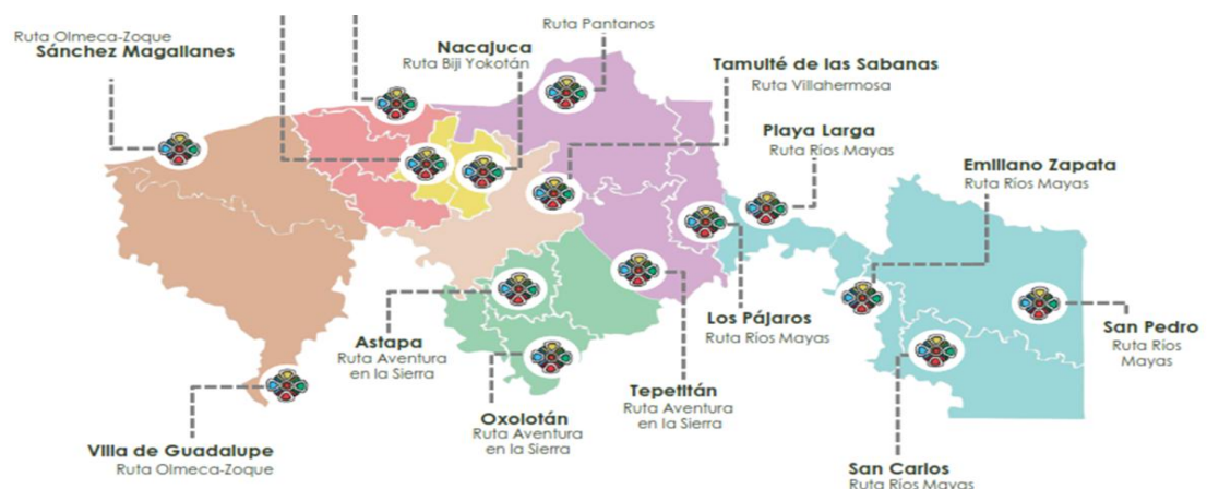
Figura 2. Localidades de Tabasco para considerarse "Pueblos Pintorescos"