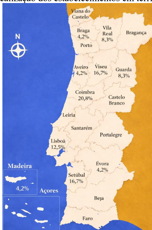
Figura 3. Localização dos estabelecimentos em território nacional.

Em termos de localização dos estabelecimentos destacam-se Coimbra (20,8%), Setúbal (16,7%) e Viseu (16,7%), que somam mais de 50% da amostra, embora surjam outros distritos como Aveiro (4,2%), Braga (4,2%), Évora (4,2%), Guarda (8,3%), Madeira (4,2%), Lisboa (12,5%) e Porto (8,3%) o que apresenta uma distribuição geográfica de grande parte do território nacional (Figura 3).