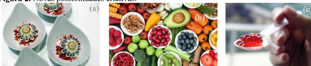
Figura 2. Novas possibilidades criativas.