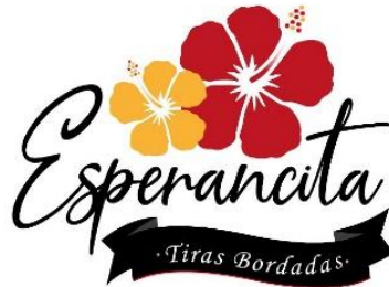
Figura 2. Patrón de tulipanes, logotipo de la artesana Esperanza Pérez Tosca