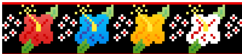
Figura 4. Patrón de la tira bordadas con tulípanes tabasqueños.