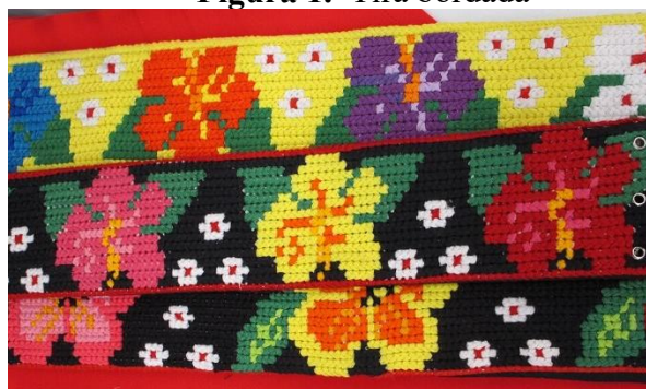
Figura 1. Tira bordada