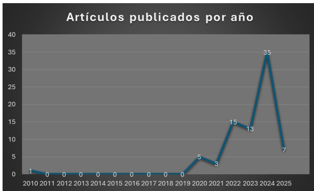
Figura 1. Artículos sobre turismo regenerativo publicados por año