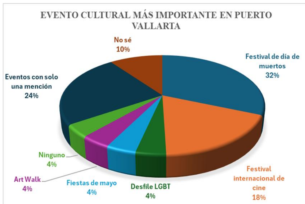
Figura 2. Evento cultural más importante en el municipio de Puerto Vallarta, Jalisco.

Fuente: Elaboración propia a partir de datos obtenidos de “ Towards sustainable cultural tourism: analysis of cultural policy in the municipality of Puerto Vallarta, Jalisco, México ” (López, P. & Gilabert, C., 2024)