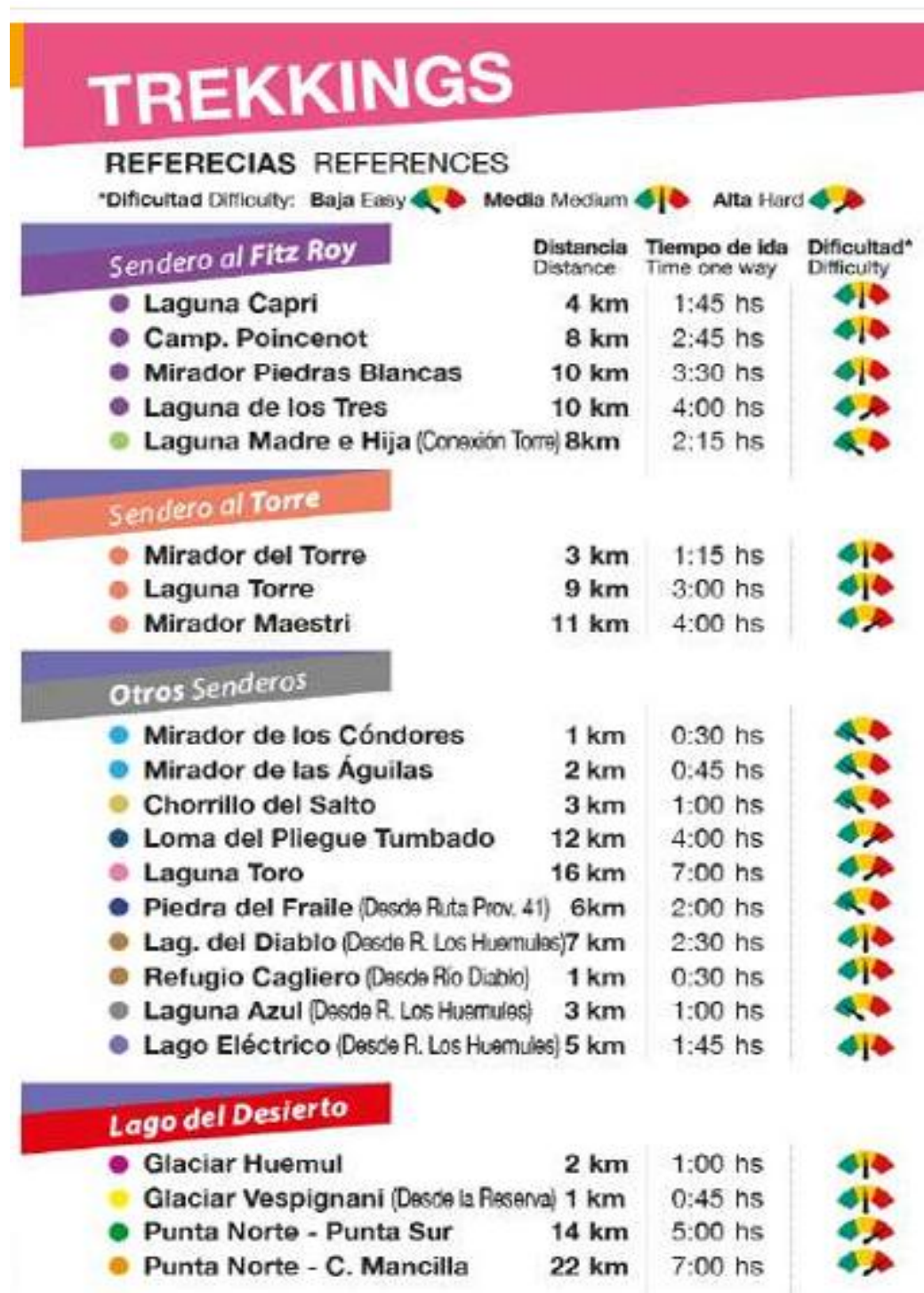
Figura 3. Senderos de El Chaltén