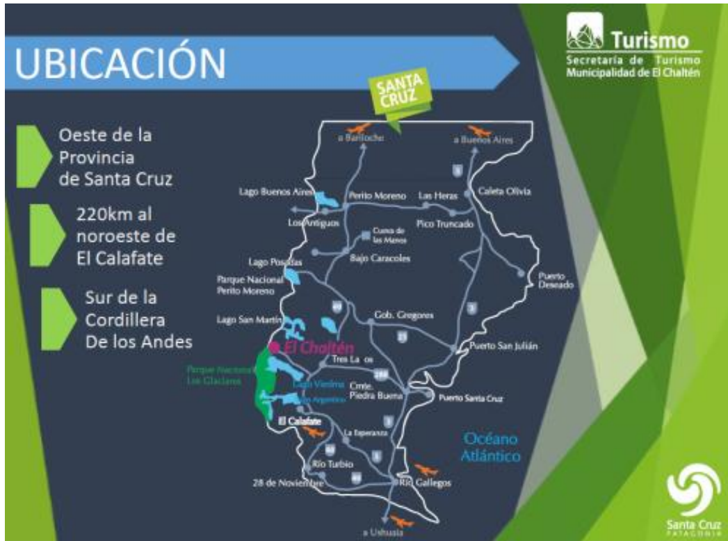
Figura 1. Ubicación de El Chaltén, en la provincia de Santa Cruz, Patagonia Argentina.