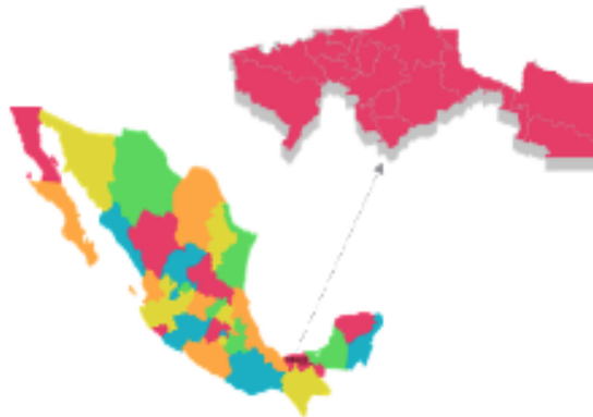
Figura 1. Ubicación del Estado en México

Tabasco se divide en 17 municipios; su capital es la ciudad de Villahermosa, perteneciente al municipio de Centro. Villahermosa fue fundada en el año 1557 y desde el 24 de junio de 1641 es la sede de los poderes del estado (Gobierno del Estado de Tabasco, 2020).