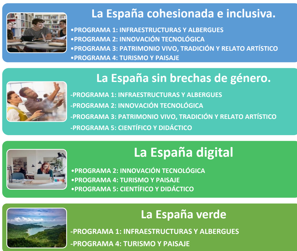
Figura 5. Esquema de los PROGRAMAS en función de las cuatro transformaciones del Plan “España Puede”.

Atendiendo además al cumplimiento de los estándares necesarios para optar a un programa de financiación de fondos europeos.