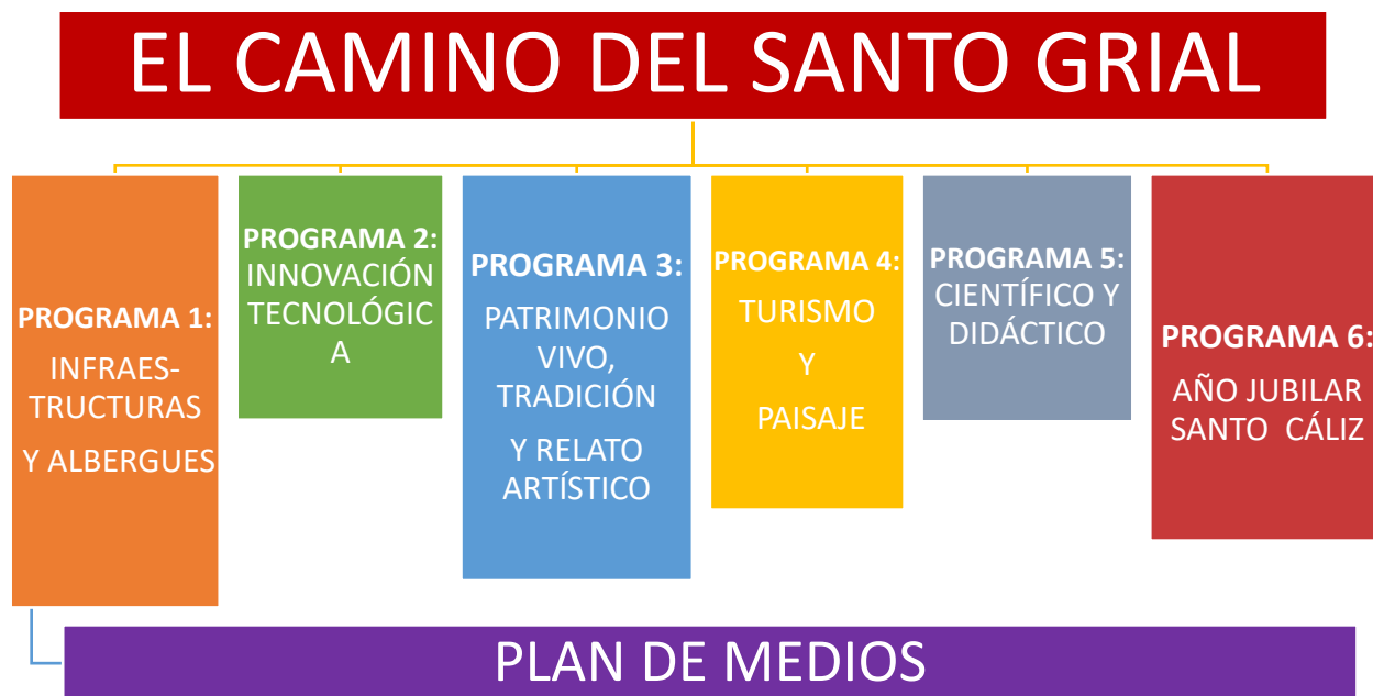
Figura 4. Esquema de los programas del Camino del Santo Grial.