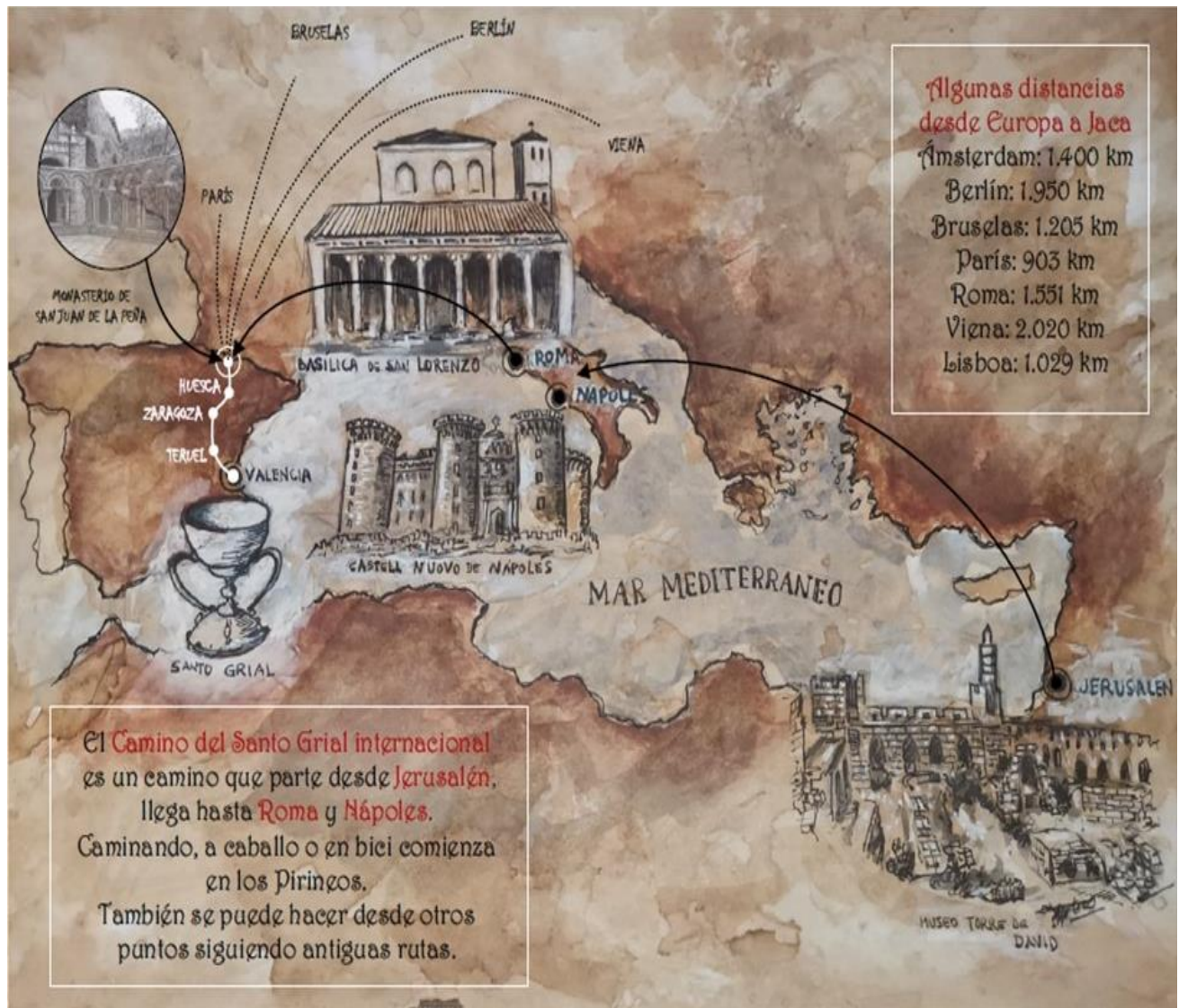
Figura 3. Credencial de Peregrinación del Camino del Santo Grial, Ruta del Conocimiento, camino de la Paz. (2019).

El esquema básico de desarrollo de este plan contempla varios programas los cuales presentamos a continuación.