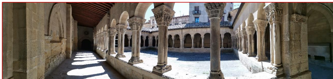
Figura 1. Claustro de San Pedro el Viejo, Huesca. 2020.