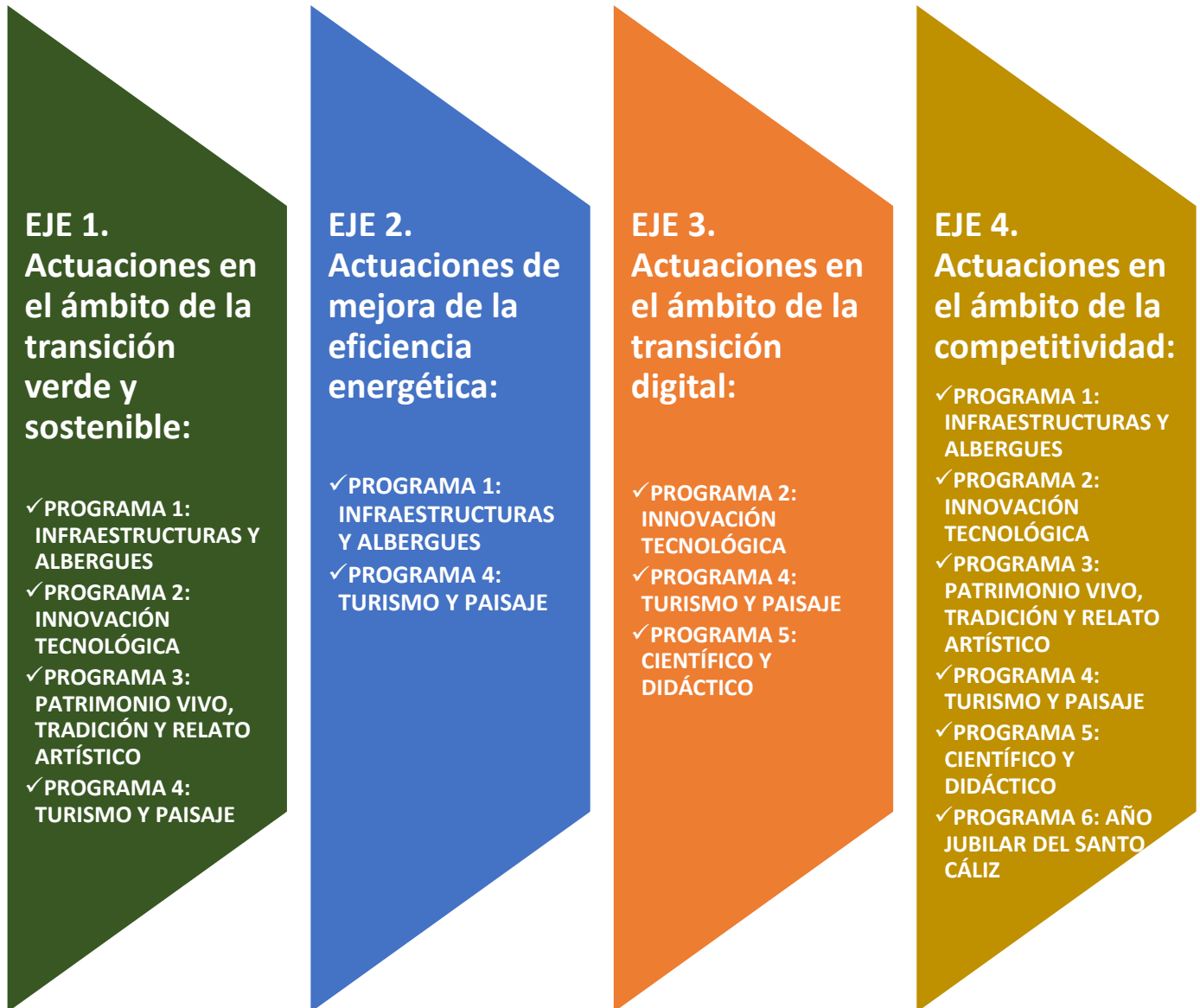
Figura 6. Relación de los PROGRAMAS del camino del Santo Grial con los 4 ejes prioritarios del Gobierno de España.