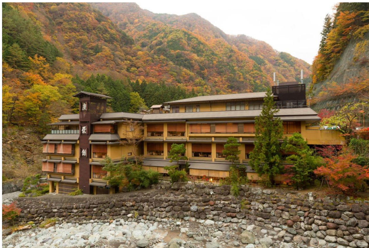
Figura 2. Entorno del Nishiyama Onsen Keiunkan.