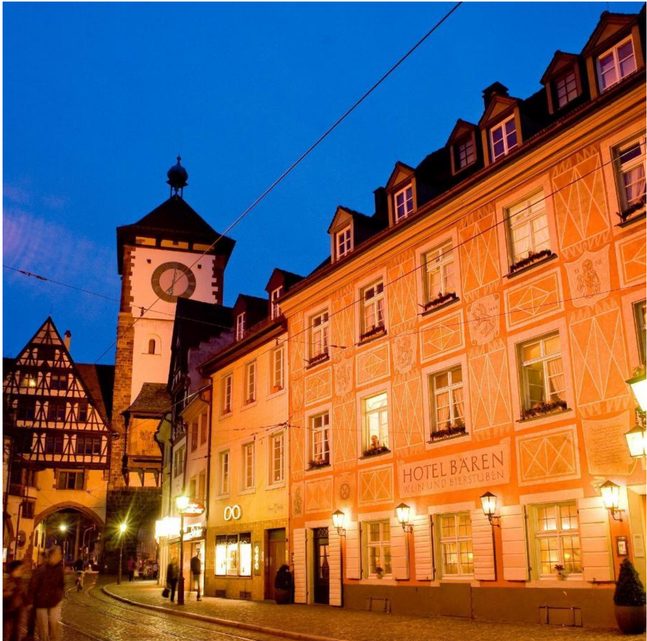
Figura 4. Gasthaus Zum Roten Bären.