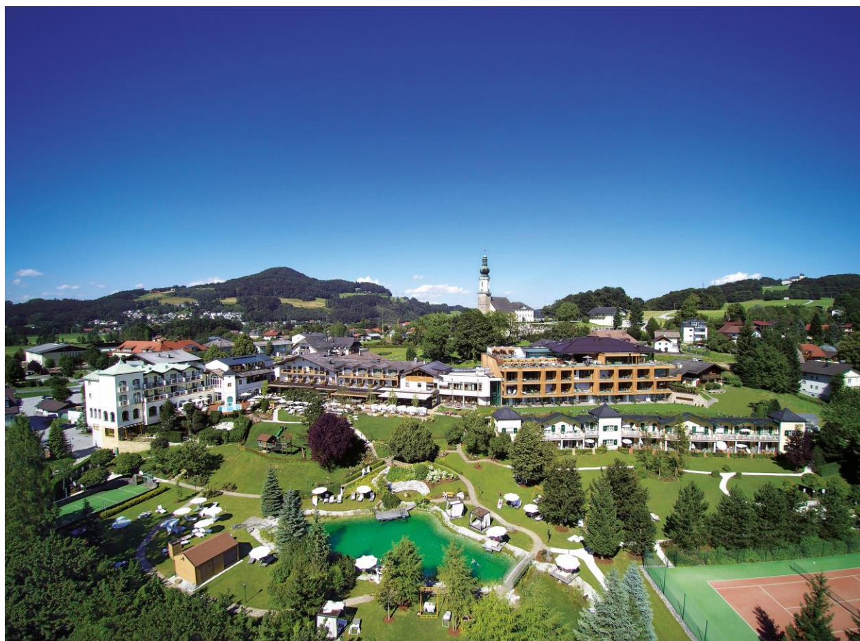
Figura 12. Hotel Gmachl.

En cuanto a sus servicios, dado que posee una elevada categoría proporciona alta calidad, un servicio detallado, interesantes programas de actividades, una alta cocina con productos locales y regionales.