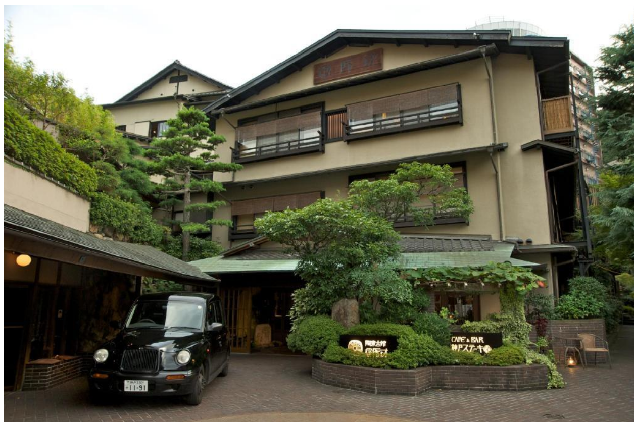
Figura 7. Hotel Tōcen Goshoboh.

La ciudad en la que se encuentra localizado es conocida como Arima Onsen en Kobe y es el complejo turístico de aguas termales más antiguo de Japón. Se piensa que data de 1000 años atrás. Los manantiales más importantes se dividen en dos categorías: dorados ( kinsen ) y plateados ( ginsen ). En los primeros, el agua que corre de la fuente es clara, pero, debido a su alto contenido en hierro, se oxida y cambia de color cuando entra en contacto con el aire. La segunda modalidad tiene dos variedades. Por un lado, las carbonatadas ricas en ácido carbónico y, por otro lado, las de radón contienen radio.