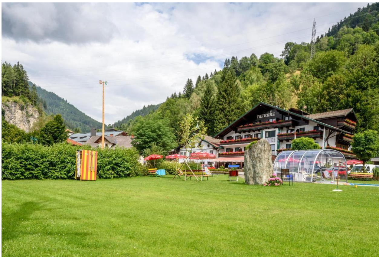
Figura 6. Jardines del Hotel Taferne.

verano, los clientes pueden disfrutar del entorno practicando senderismo o escalada, relajarse en el césped del hotel (Figura 6) disfrutando al aire libre de sus comidas y/o barbacoa semanal. Llegado el otoño, cuando los verdes del entorno comienzan a cambiar sus colores, se puede optar por practicar senderismo, bicicleta de montaña o ciclismo. Ya bien entrado el invierno, las posibilidades aumentan pudiendo disfrutar de la nieve y el entorno. El hotel tiene también una sala para guardar esquís, una sala de esquí con calentadores disponibles para todos los huéspedes y, además, un spa que ofrece sauna con infusión, cabina de infrarrojos, lugares de descanso y duchas. Y finalmente, una vez llegada la primavera, la naturaleza vuelve a florecer y mostrar sus colores, aunque paralelamente en las montañas, muchas pistas de esquí permanecen abiertas.