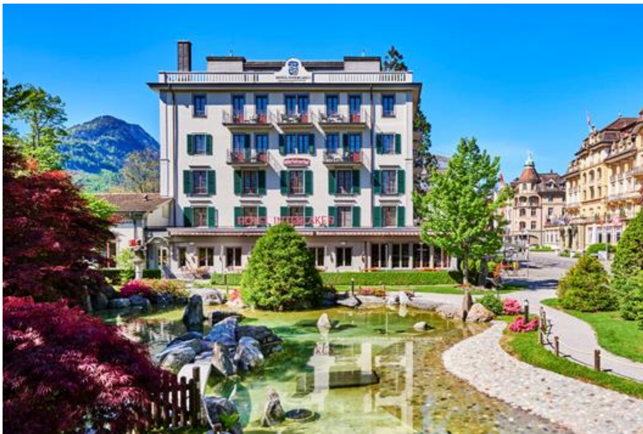
Figura 11. Hotel Interlaken.

homenaje, se nombraron dos habitaciones.