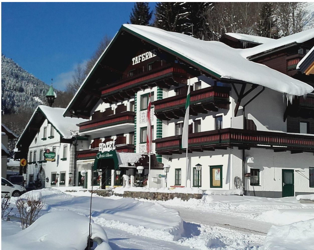
Figura 5. Hotel Taferne.

El hotel Taferne (Figura 5) se encuentra en un área popular como destino turístico y sobre todo para deportes de invierno y senderismo. Actualmente lo regenta la quinta generación de la familia Schmidt. Así pues, el hotel destaca por su ambiente familiar, acogedor y por su variada cocina que hace uso de productos locales para dar un toque tradicional a sus platos.