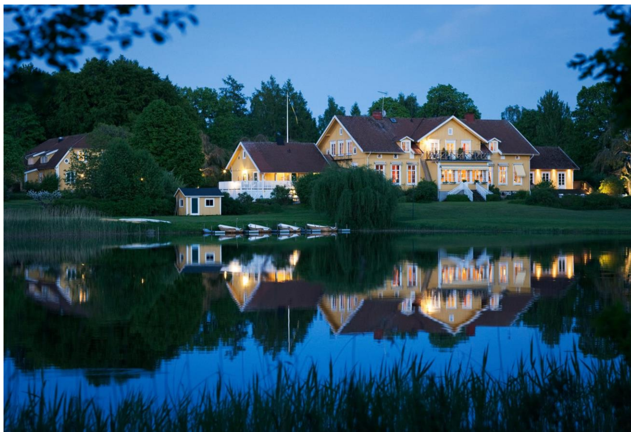
Figura 13. Toftaholm Herrgård.

(Stenbock), teniendo una historia agitada. Las habitaciones también tienen muchas historias detrás. Y es que, por ejemplo, el ala sur es la más antigua y se llama " el piano de cola de Katarina Stenbock ", por la tercera esposa de Gustav Vasa e hija de Gustav Olsson (Stenbock). El ala norte se llama " el piano de cola de Gustav Adolf ", que recibió su nombre después de que el rey Gustav Adolf pasara la noche en este establecimiento cuando estaba en lucha contra los daneses. Destacar que este hotel ofrece multitud de servicios y actividades. Dispone de spa, gimnasio, alquiler de bicicletas, barcos y/o canoa y comidas y cenas (Figura 13).