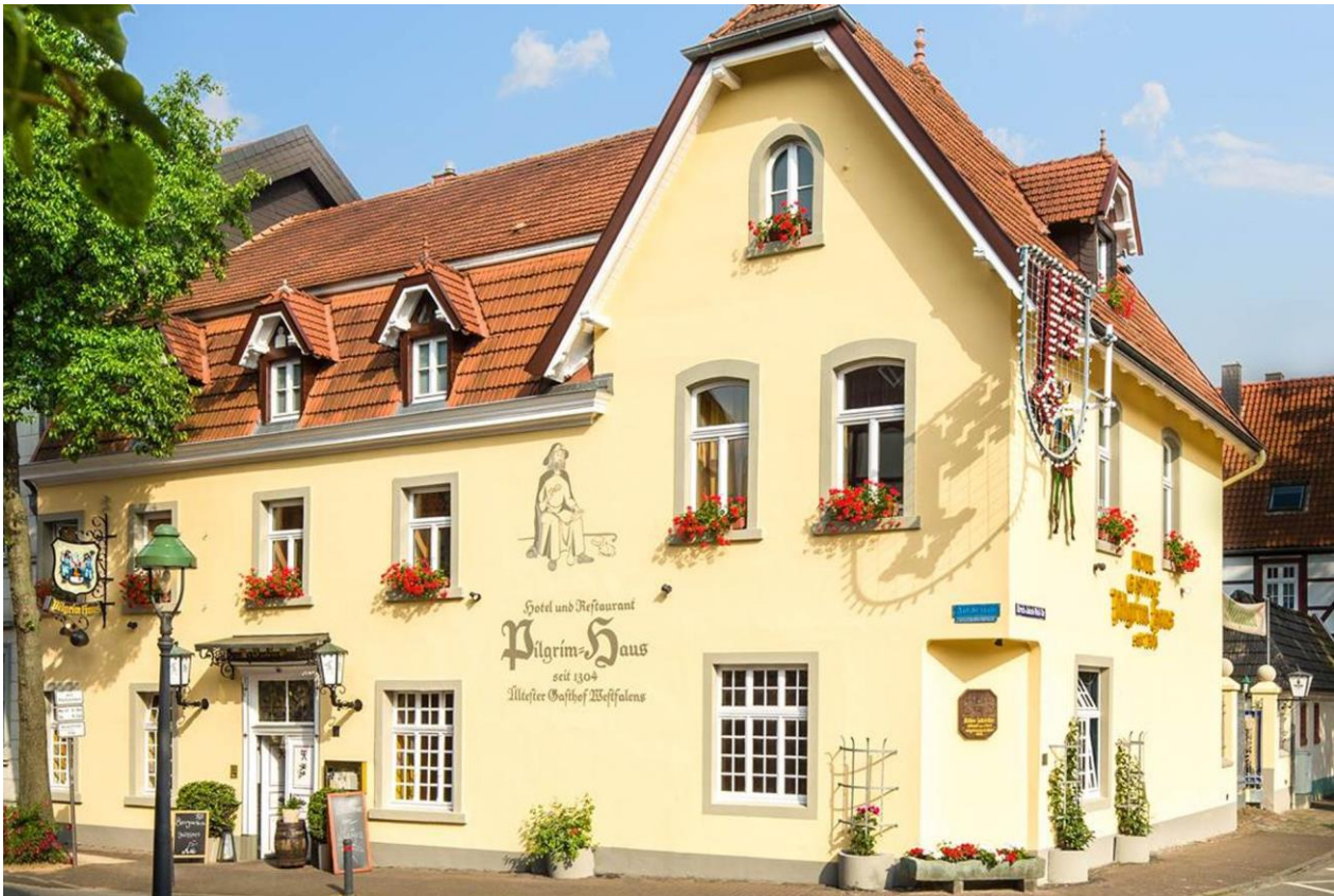
Figura 10. Hotel Pilgrim Haus.