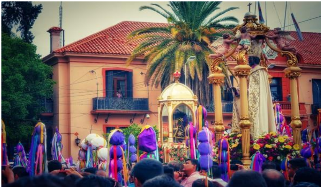
Figura 14. Un momento del Tinkunaco frente a la Casa de Gobierno