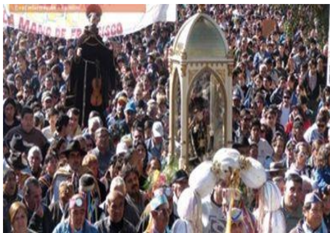
Figura 9. El Niño Alcalde, San Francisco Solano, la cofradía de los allis , promesantes y fieles