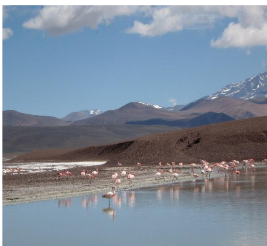
Figura 5. La Laguna Brava, La Rioja, Argentina