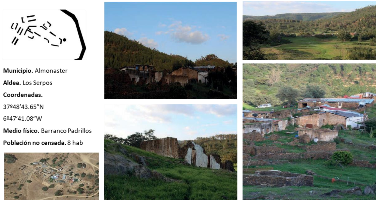
Figura 5. Aldea de Los Serpos (Almonaster la Real).

Referencias: Ortofoto Visor Bing Mapas (2020).