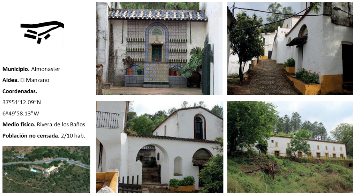
Figura 3. Aldea de El Manzano o Balneario (Almonaster la Real).