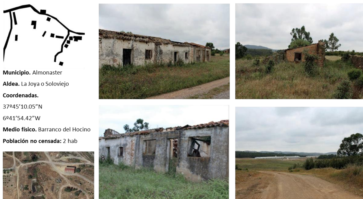
Figura 2. Aldea de La Joya o Soloviejo (Almonaster la Real).

Referencias: Ortofoto Visor Bing Mapas 35 (2020).