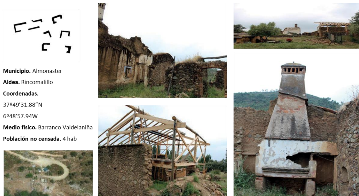
Figura 4. Aldea de Rincomalillo (Almonaster la Real).