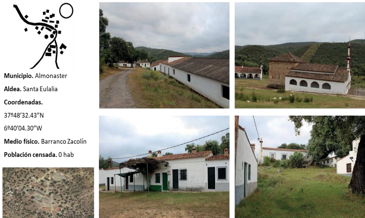
Figura 6. Aldea de Santa Eulalia (Almonaster la Real).

Aldea de Santa Eulalia 44 . Es en la actualidad un lugar 45 de peregrinación localizado a 18.10 km de Almonaster 46 . Este recinto, declarado Bien de Interés Cultural, a día de hoy es un complejo con varias casas y una Ermita asentada sobre restos de un mausoleo romano en lo que se llamó antaño la Argujuela, además de contar en su entorno una pequeña plaza de toros existente desde el 1678. Realmente no se tiene constancia de que haya sido un núcleo de población residencial, aunque así consta en Instituto de Estadística de Andalucía.