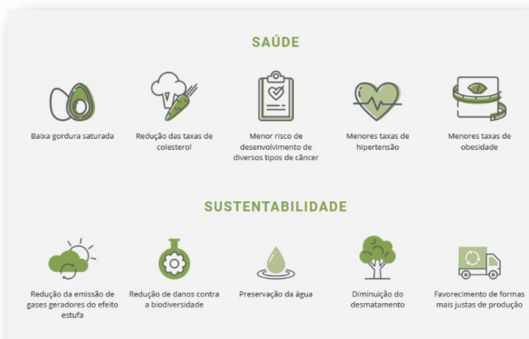
Figura 2. Benefícios da Alimentação Consciente