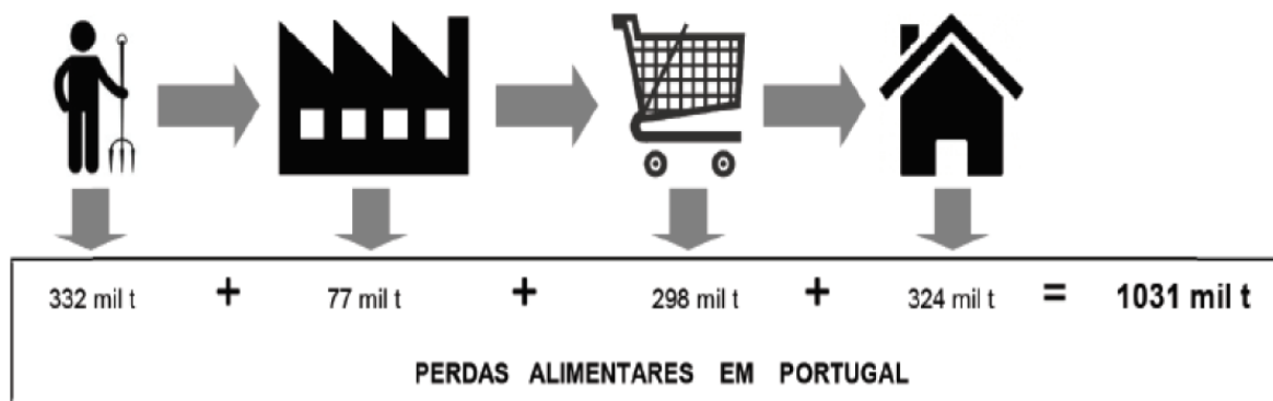
Figura 4. Perdas alimentares anuais na cadeia de aprovisionamento em Portugal

Fonte: Baptista et al. (2012); Ortiga (2017)