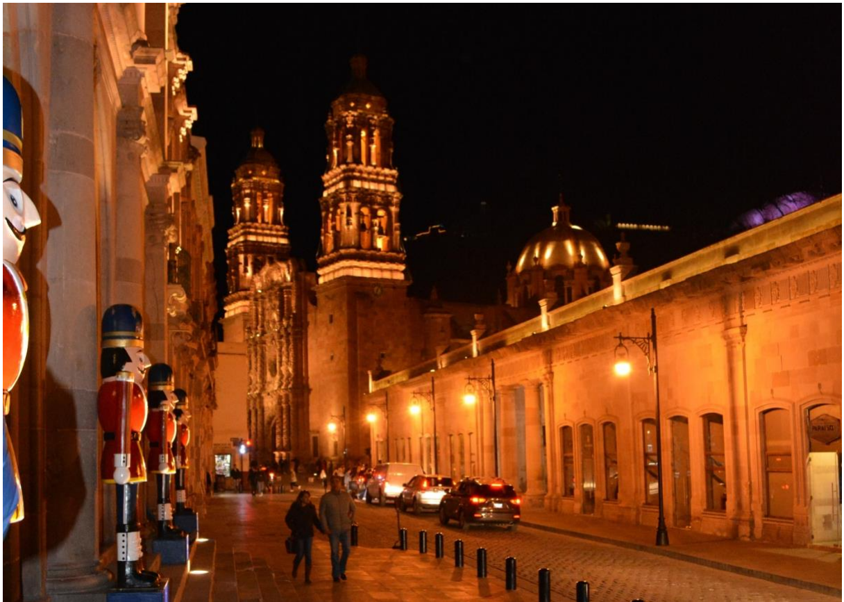
Figura 8. Centro Histórico de Zacatecas (2020).

La Ciudad de Zacatecas debido a la riqueza minera encontrada en ella, fue parte importante de la colonia española, desde su surgimiento (siglo XVI), y de esta manera fue evolucionando a la