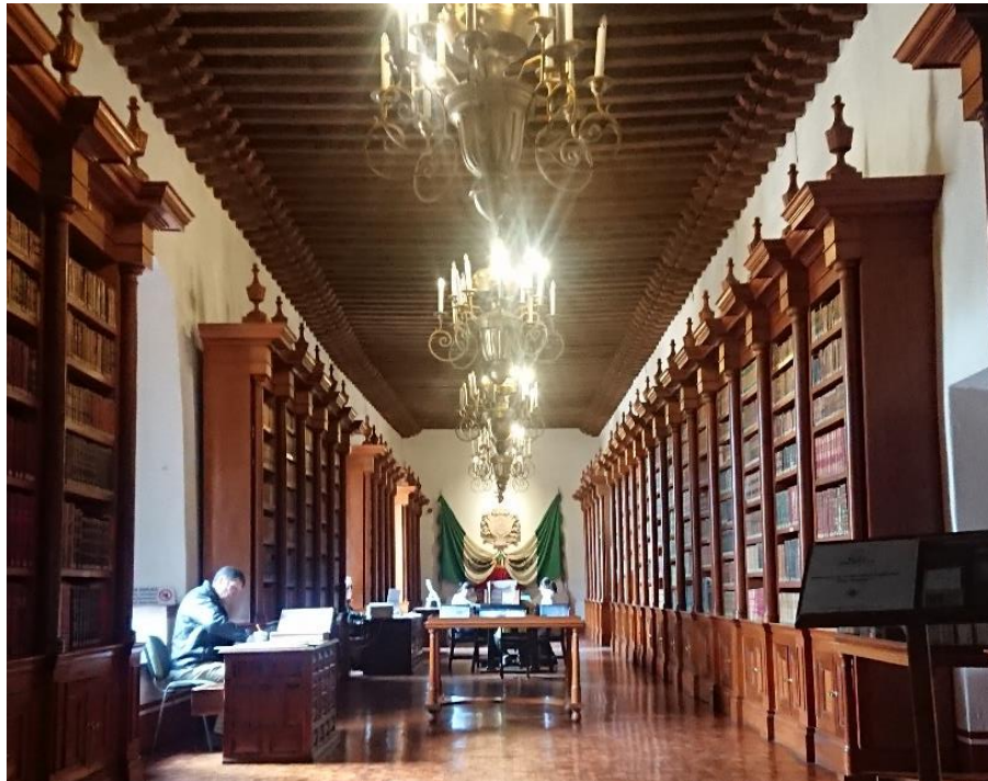
Figura 3. Biblioteca Elías Amador en las instalaciones del Museo Pedro Coronel.