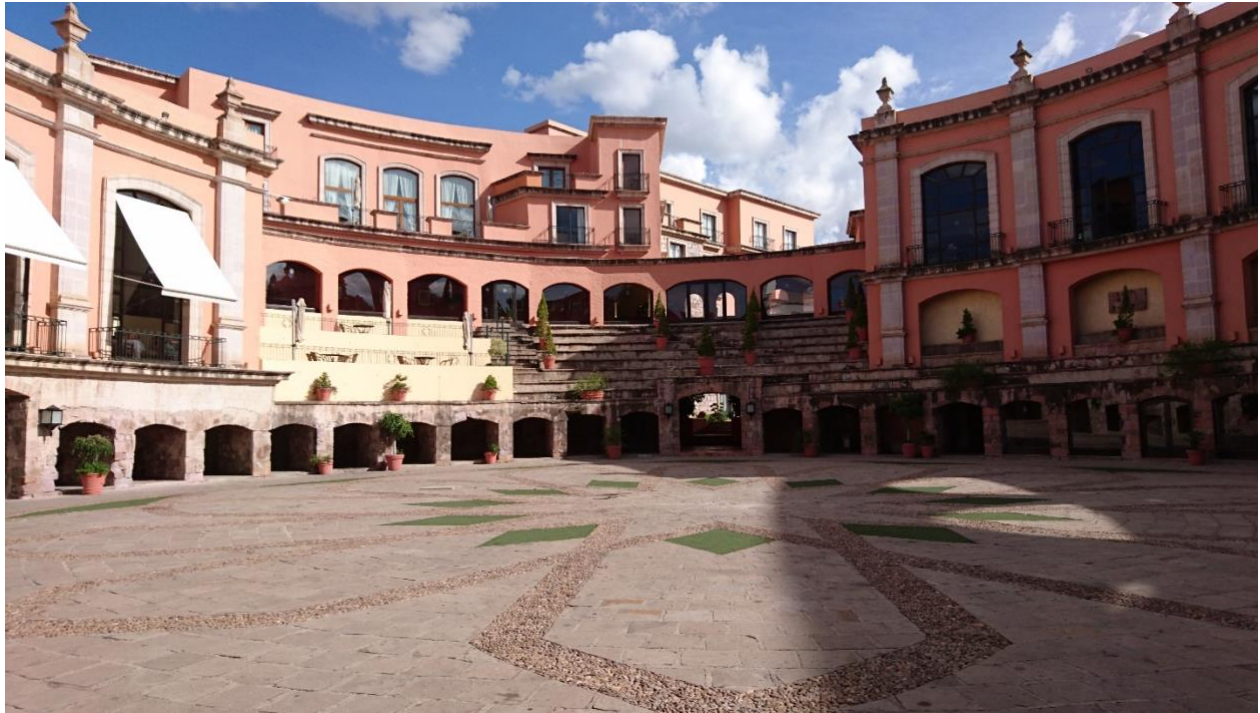
Figura 5. Hotel Quinta Real -Antigua Plaza de Toros San Pedro- (2019).

La San Pedro, recinto dedicado a la fiesta brava fue abandonada y, es hasta los años 80 que se hace una inversión privada para transformarla en Hotel de cinco estrellas, tan bien logrado que continúa reflejando su esencia taurina. De tal forma que se ha convertido en una adaptación contemporánea, un reciclaje del espacio arquitectónico que ha generado un constante análisis, pues, por un lado, rescató a la construcción del deterioro evidente y por otro, colocó a la ciudad en la mira nuevamente por su arquitectura y la intervención al inmueble que hoy alberga al hotel Quinta Real.