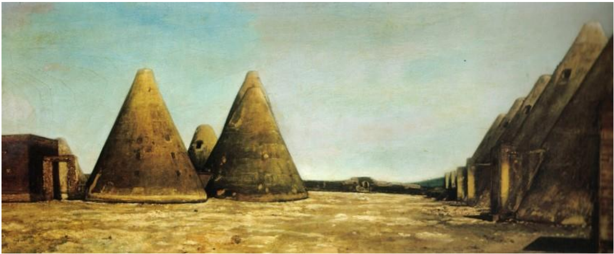
Figura 6. Francisco Goitia, Paisaje de Santa Mónica , 1934, óleo sobre tela.

que hasta el último sábado del año 2019, ofreció una experiencia gastronómica, ofertando dentro de su contexto inmediato artesanías, así como un taller de cerámica de barro y la posibilidad de observar parte de la obra de Goitia, teniendo en mente por supuesto que este programa turístico continúe en los próximos meses.