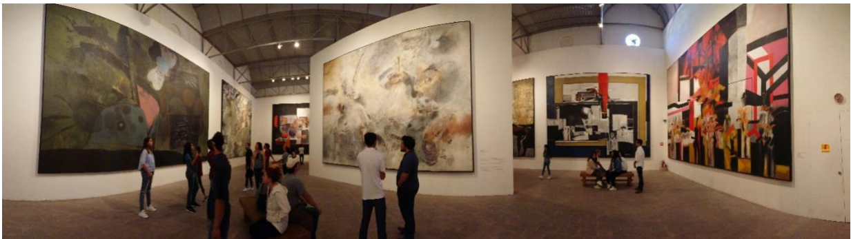
Figura 4. Murales de Osaka '80 en el Museo Manuel Felguérez (2019).

En los años sesenta, fungió como penitencinaria estatal, lo que provocó que se interviniera el inmueble para que pudiera cumplir con esta función hasta 1995, dos años más tarde, el gobierno estatal se propuso restaurarlo y adecuarlo apropiadamente para darle un nuevo uso, el de Museo de Arte Abstracto, abierto al público un año más tarde, aunque, se ampliaría y reinauguraría al iniciar el siglo XXI, procurando desde entonces mantenerlo en las condiciones más apropiadas para su óptimo funcionamiento y disfrute.