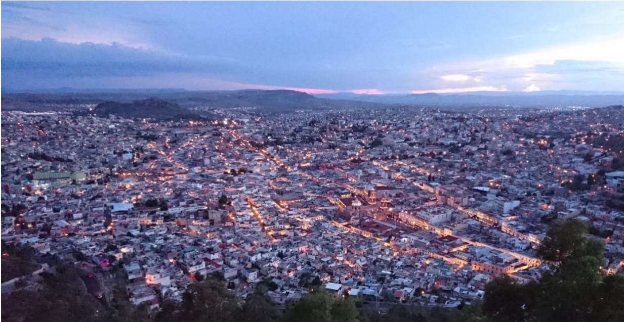
Figura 1. Panorámica Centro histórico de Zacatecas 2019.

De esta manera se ha logrado un impacto turístico en la población, tanto nacional como internacional, que deviene en importantes niveles de crecimiento y desarrollo económico de la entidad. Son todos estos factores -la riqueza arquitectónica, la salvaguarda patrimonial, la cultura- los que contribuyen significativamente para lograr que el impacto turístico en la población tanto nacional como internacional abone al crecimiento económico del estado de manera crucial, por lo que incluso las autoridades estatales se han preocupado por crear y dar seguimiento a estrategias de mercado en las que la ciudad sea vista como una oferta para el turismo cultura e incluso, el ámbito recreativo.