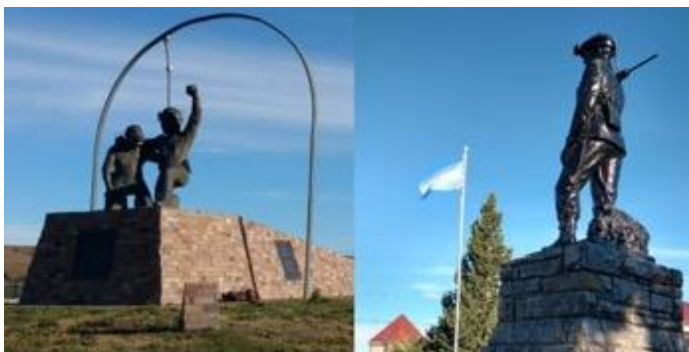
Figura 5: Esculturas de Mineros de la Cuenca Carbonífera de Río Turbio.

y del marco legal). Como toda actividad extractiva, se supone desde el inicio de su explotación, el agotamiento de los minerales (carbón en este caso) en un determinado tiempo. El desarrollo de la actividad y el cierre de una mina, están determinados por el agotamiento del mineral pero también puede deberse a la reducción o sustitución en la demanda de los minerales por otros productos sucedáneos.