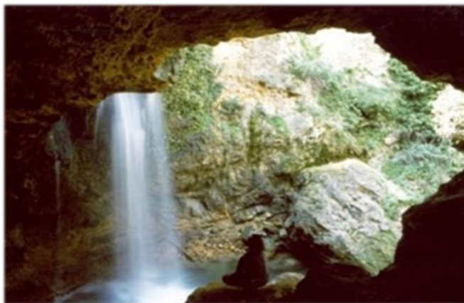
Figura 11: Pozo de Las Palomas, Utrillas.