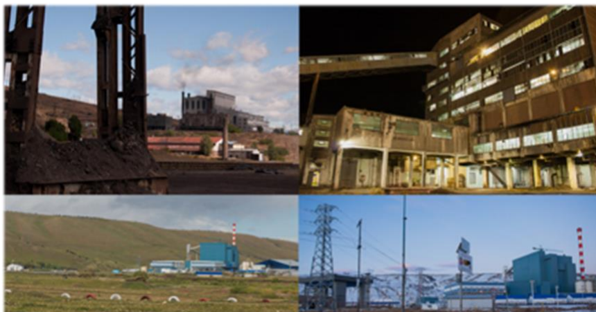
Figura 7: Usinas Termoeléctricas y Planta depuradora de YCRT.