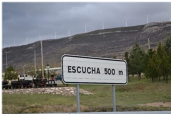
Figura 8: Acceso a la localidad de Escucha en donde se encuentra el Museo Minero. Coexistencia de energías renovables y no renovables en un mismo sitio.