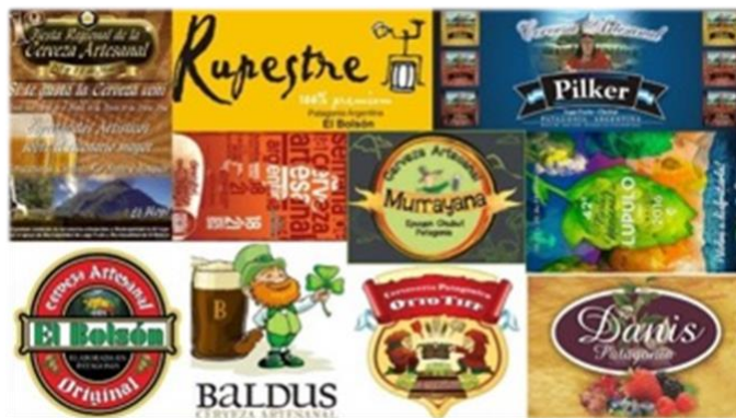
Figura 15: Composición de logos y cartelera de cervezas artesanales y fiestas regionales de la Comarca Andina del Paralelo 42°.

Comarca de otros destinos turísticos fuertes que se encuentran muy cercanos (Esquel y Bariloche) ha pasado por la modalidad turística.