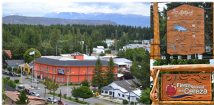
Figura 16: Comarca de Los Antiguos.

Para el año 2009 13 se constituye una sociedad civil con la denominación de La Comarca de Los Antiguos en la localidad de Pico Truncado, indicando dicho nombre uso y costumbre de tal designación.