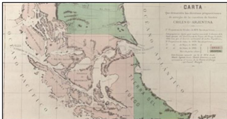
Figura 2: Mapa del Tratado de Límites entre Argentina y Chile, 1881.