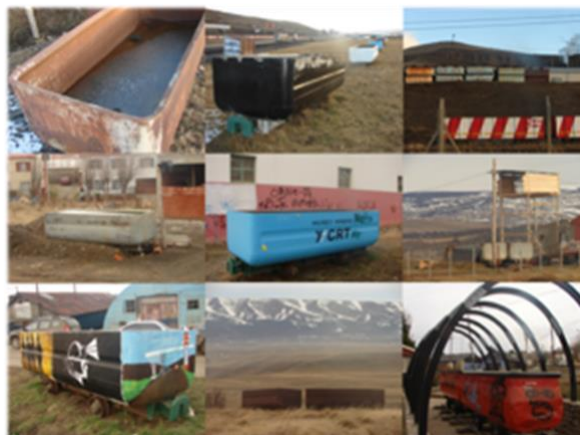
Figura 6: Paisaje Cultural Minero en la Cuenca del Río Turbio.

• Paisaje Natural modelado por la Actividad Minera: se hace necesario tener en mente la perspectiva que nos ofrece la ecología cultural para entender como una cultura se adapta a su ambiente a través del tiempo (Steward, 1955) al expresar que la Cuenca del Río Turbio resume un paisaje cultural minero dentro de un paisaje natural que se generó a lo largo de años de ocupación (González, 2013). El paisaje del interior y del exterior de la mina, el mineral y del estéril, el socavón, los restos de material de mina esparcidos por el campo, la vegetación que deja paso a la tierra estéril, se convierten en una seña de la identidad cultural del minero.