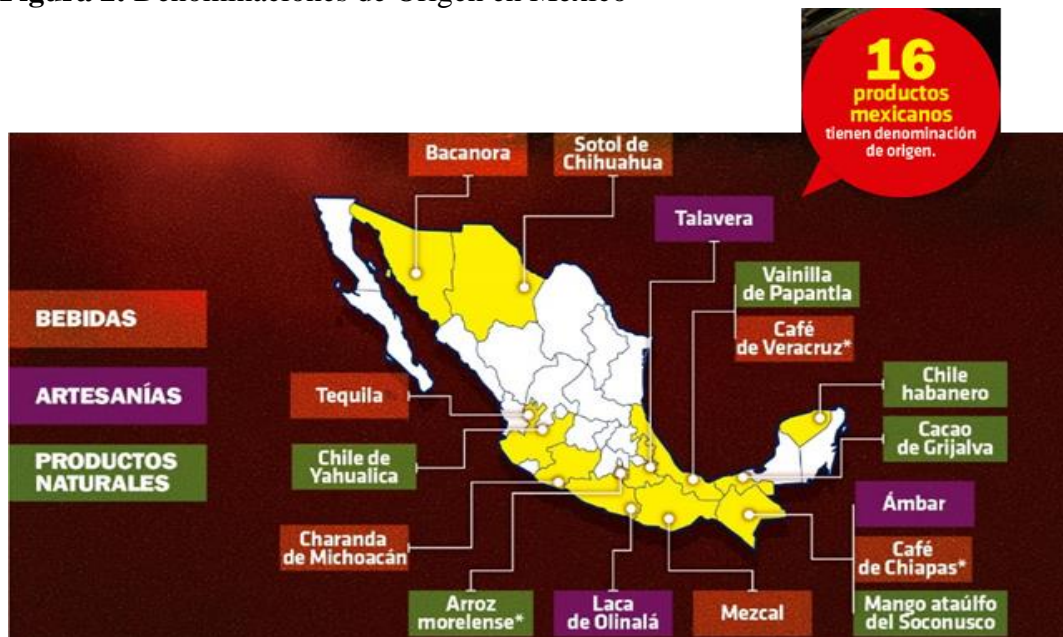
Figura 2. Denominaciones de Origen en México